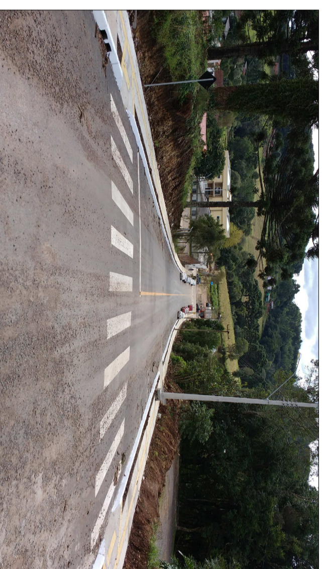
CONTINUAÇÃO DO PISO EXISTENTE

RODRIGO WITT ENGRº CIVIL - CREA RS 172076 SETOR DE ENGENHARIA