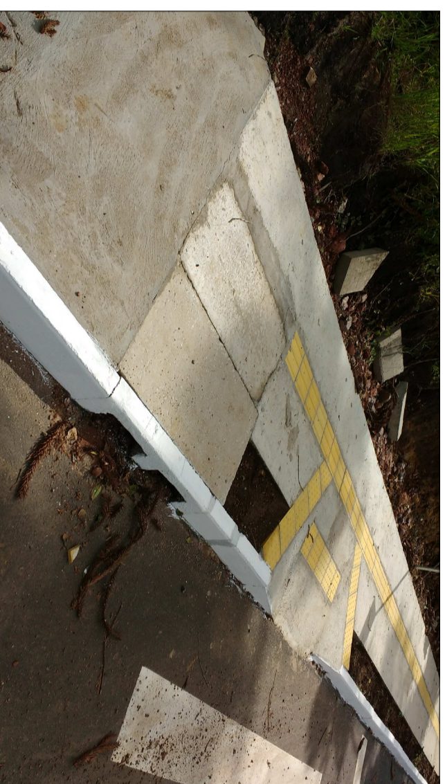
CONTINUAÇÃO DO PISO EXISTENTE